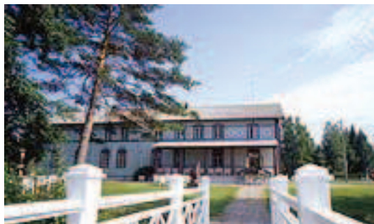
Jotain ajankohdasta mm. Salmela on auki 12.8. asti!

Matkan ajankohdaksi on valittu elokuva, on vielä lämmintä ja maisemat silmiä hivelevät! Tekisimme rentouttavan taidematkan yllämainittuihin paikkoihin Tarkemmat päivämäärät ja hintatiedot kesäkuun alussa! Mikäli olet kiinnostunut matkasta vaikka perheesi kanssa ota yhteyttä